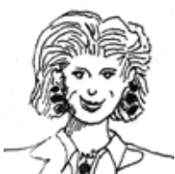
1. sig.ra Mumm Amburgo/Brema